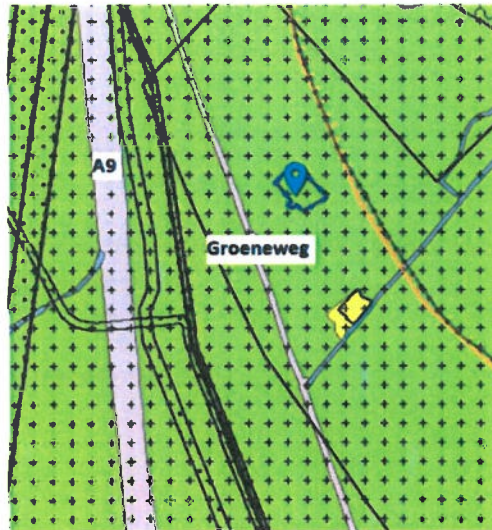
Kaartje uitsnede bestemmingsplan 'Buitengebied'